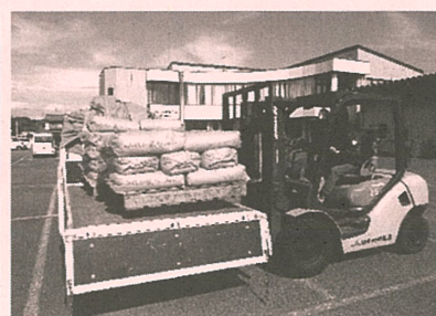
長沼支店は、お米であふれています！