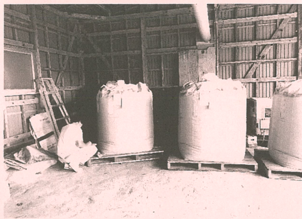
農家さん宅への産米集荷の様子！ フレコンの集荷が増えました。